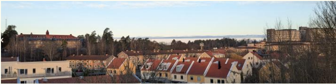
Novembermorgon över garnisonen och US